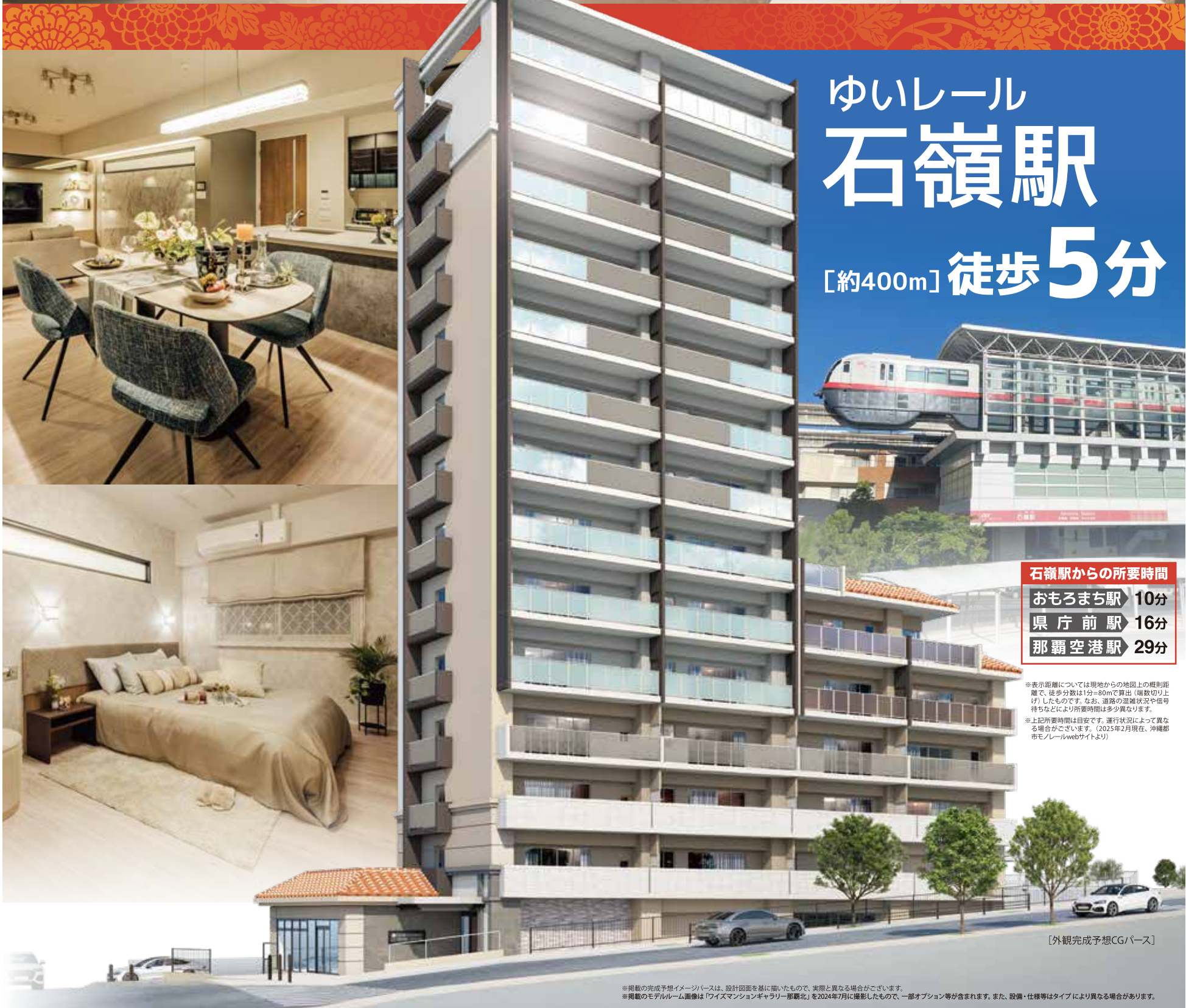
[エントランスホール完成予想CG/パース]

生活利便、通勤・通学利便、 そこに暮らす人々が感じる それぞれの価値。 首里石嶺の真価をあなたに。