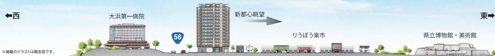
※掲載のイラストは概念図です。